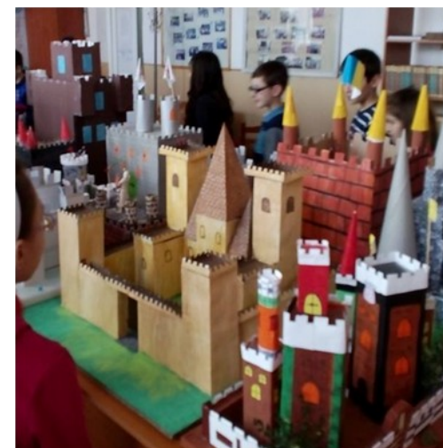
REALIZAREA DE MACHETE ALE UNOR CASTELE MEDIEVALE