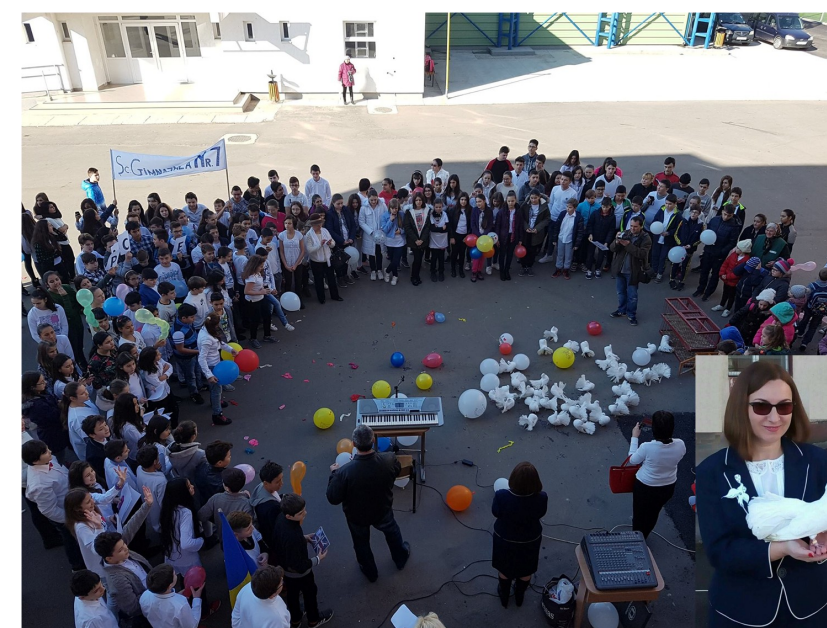
Porumbeii păcii au sosit la școala noastră!