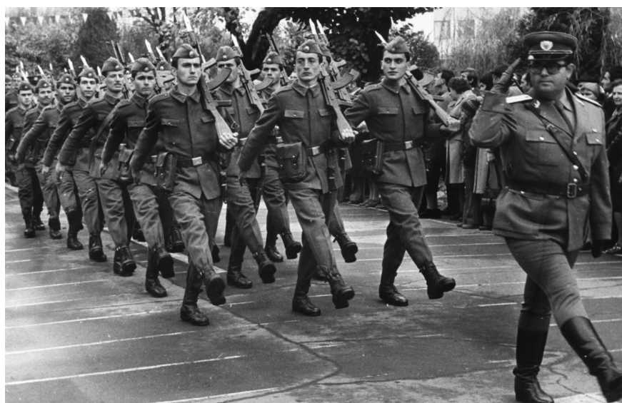
Soldați la defilare 1980