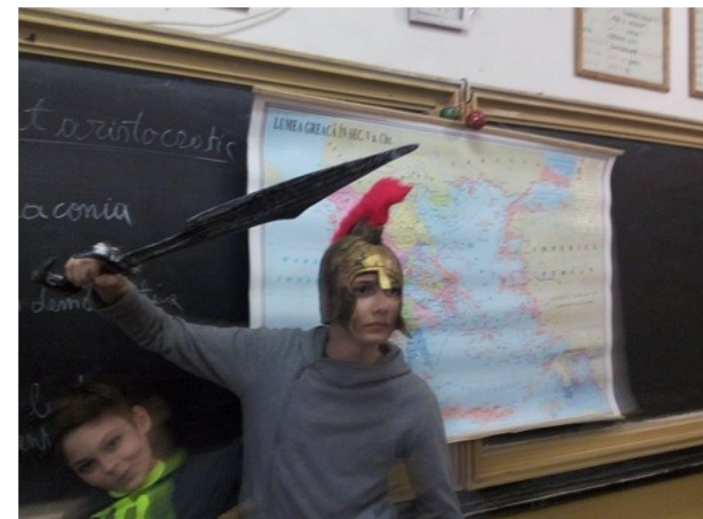
SCENETĂ DIN GRECIA ANTICĂ