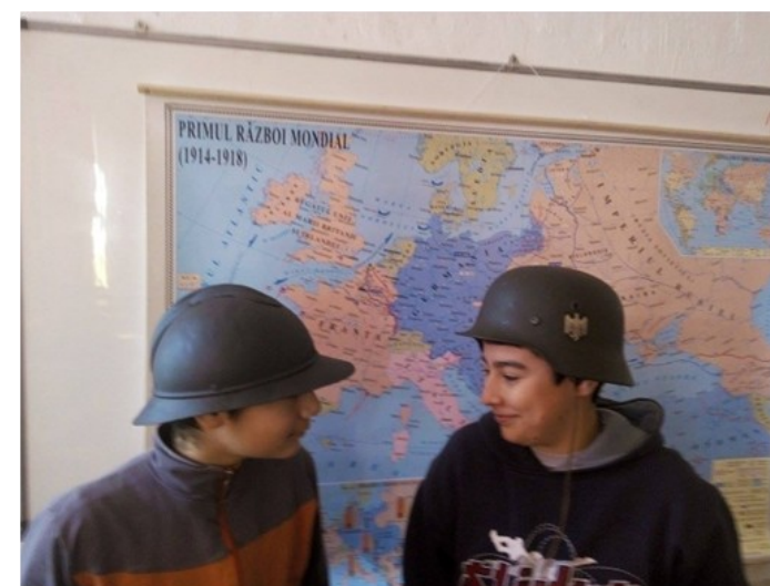
MIJLOACE DIDACTICE - OBIECTE - DIN PRIMUL RĂZBOI MONDIAL