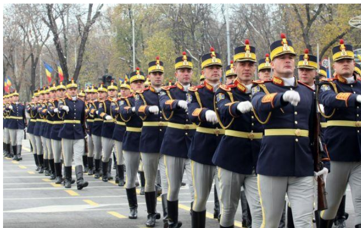
Oșteni din Garda națională la defilare 3