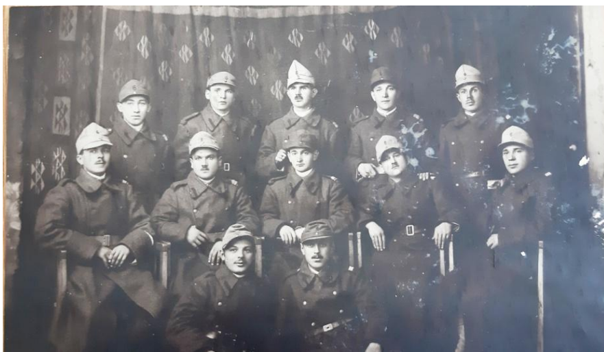
Camarazii de luptă ai străbunicului (străb. primul din stânga)