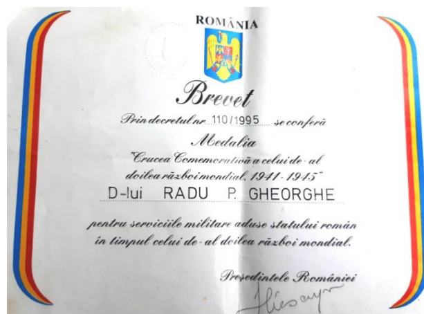
Brevet – pentru Medalia „Crucea comemorativă a celui de-al doilea război mondial 1941-1945” 2