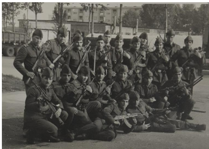
Tata și camarazii de arme 12

Să sperăm că noi vom ști să apreciem scopul pentru care a fost făcută Revoluția din 1989 pentru noi și generațiile următoare și că vom avea parte de pace în lume.