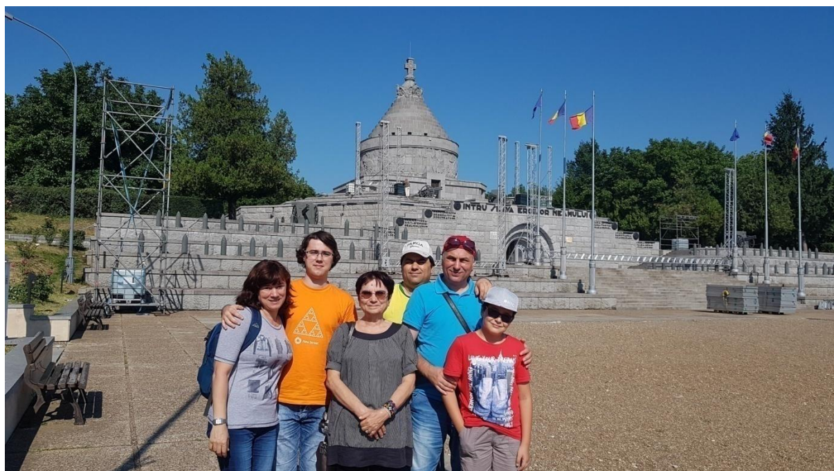
Mausoleul de la Mărășești ridicat în cinstea eroilor neamului românesc din Primul Război Mondial