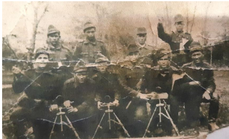
Străbunicul meu și camarazii de luptă 6

După ce s-a pus pe picioare s-a prezentat la o unitate militară, ca să nu fie declarat dezertor. Apoi s-a întors pe front și a avut norocul să se întoarcă sănătos acasă, unde a primit titlul de veteran de război, de care era foarte mândru.