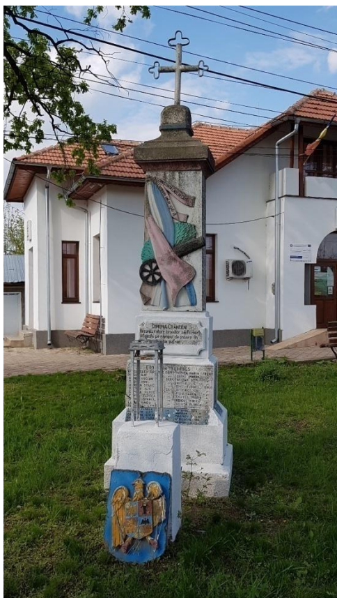
Monumentul cinstirii eroilor căzuți în Războiul pentru Independență din 1877, Primul Război Mondial și al Doilea Război Mondial, comuna Crângeni, județul Teleorman