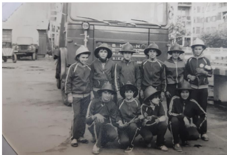
Tata și colegii săi, el este primul din stânga pe rândul al doilea 11

Pentru elevi, participarea la practică era un motiv de distracție, socializare și nu numai. Erau plătiți pentru munca depusă. Și-a cumpărat un pistol de lipit din banii obținuți, obiect ce l-a ajutat să-și practice hobbyul său, „Electronica”. El este un foarte bun electronist amator, iar pistolul de lipit îl păstrează în stare de funcționare și astăzi.