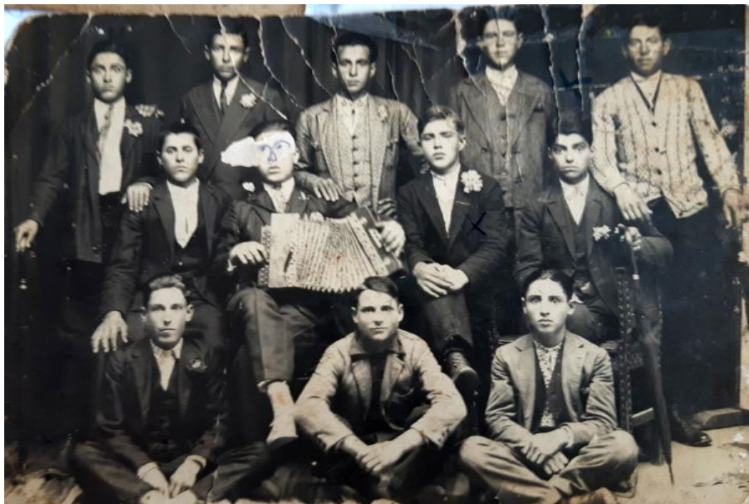
Străbunicul meu cu colegii de școală 5