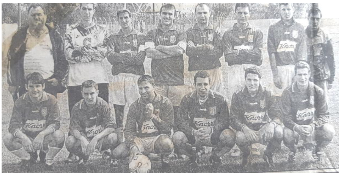
Echipa de fotbal „Olimpia Nenciulești”

Ca elemente negative erau raționalizarea alimentelor de bază care se distribuiau pe bază de cartelă: pâinea, carnea, zahărul, uleiul. Curentul electric era furnizat cu zgârcenie, la fel și căldura de la centralele termice, apa rece, apa caldă. Programul TV era doar de 2 ore pe zi, între orele 20.00 – 22.00. Era îngrădită ieșirea din țară.