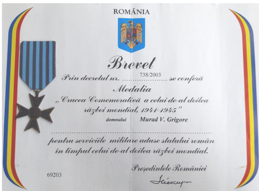
Brevetul medaliei: „Crucea comemorativă a celui de-al doilea război mondial!”