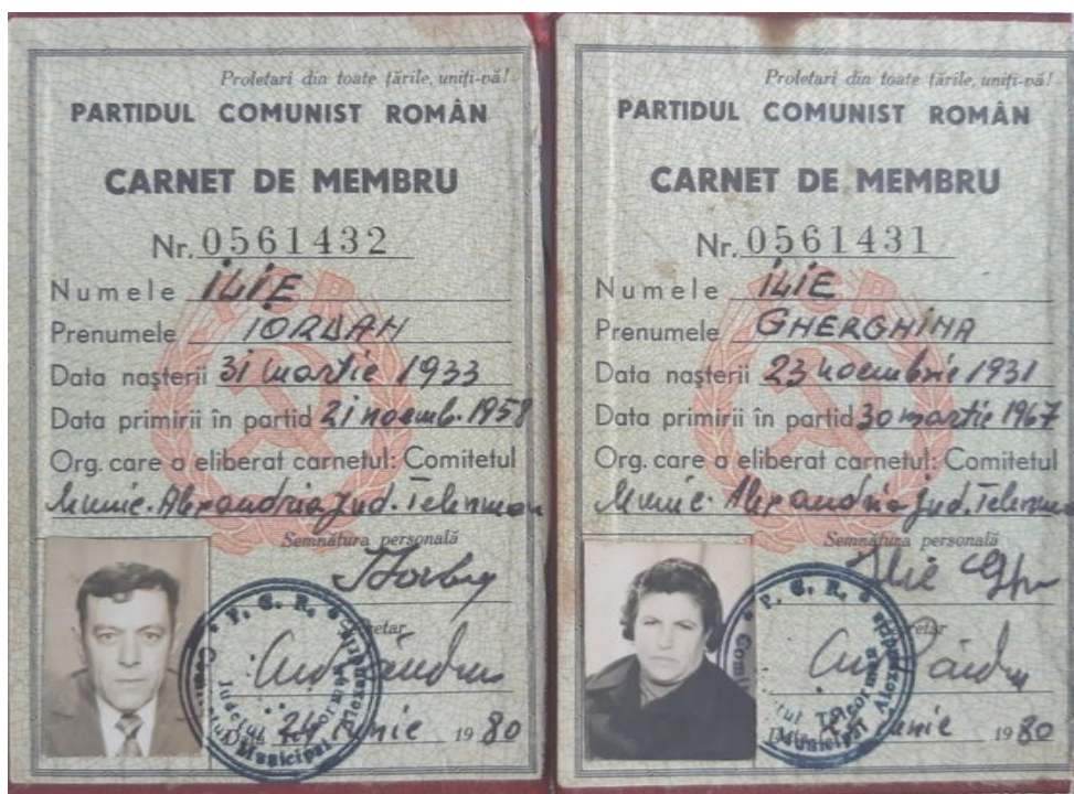
File din carnetul de membru de partid PCR 14

Televizoarele erau alb – negru și la ora 22.00 ecranele se umpleau de pureci dacă nu aveai antenă bună să prinzi canale la bulgari sau sârbi, după caz. Pe străzi, seara era întuneric și în case la fel, când se întrerupea curentul electric. 13