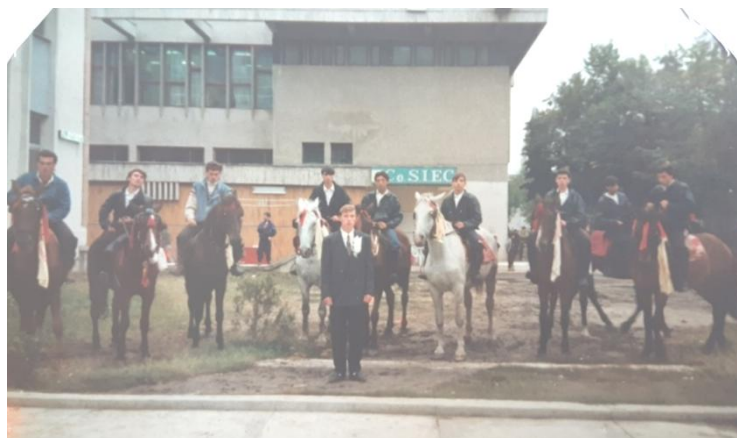
Colăcerii la nuntă în Alexandria 19

Această tradiție se încheia la biserică. 18