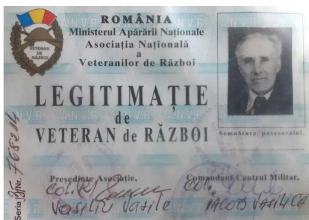
Legitimația de veteran de război a străbunicului

Timp de 7 ani nu a văzut nici un membru al familiei sale. La întoarcerea în țară a fost decorat cu „Virtutea Militară” și a primit un hectar de pământ. În 1997 a primit legitimație de veteran de război, iar în 2003 a primit medalia „Crucea comemorativă a celui de-al doilea război mondial 1941 – 1945.”