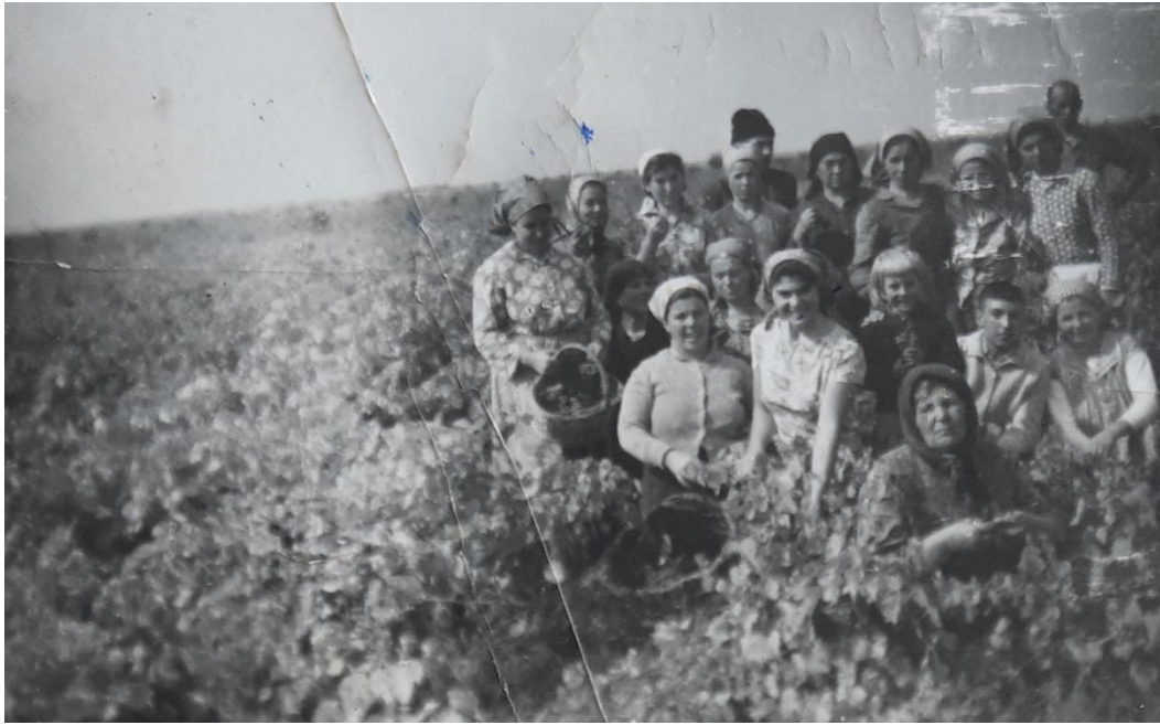
Echipa de lucru la cules la struguri