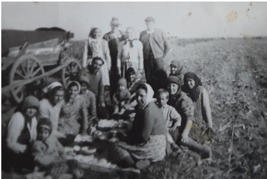
Pauza de masă la munca câmpului 15