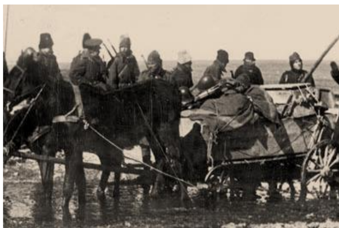
Căruță cu cai 1944 8

Fără activitatea sa dusă la bun sfârșit, toți camarazii erau în pericol să nu fie înfometaji și să rămână fără muniție. El a avut un rol important în apărarea României.