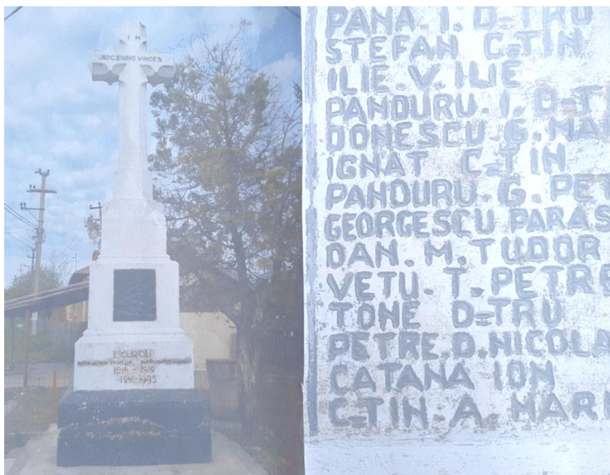
Monumentul eroilor de la Licuriciu, unde apare numele bunicului meu 7