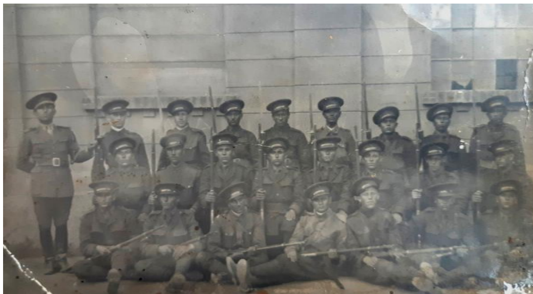
Străbunicul meu și camarazii de luptă

Când a ajuns acasă, prima grijă a fost să anunțe familia prietenului său. Când a găsit-o le-a dus și lor jumătate din tacâmuri și o foarfecă.